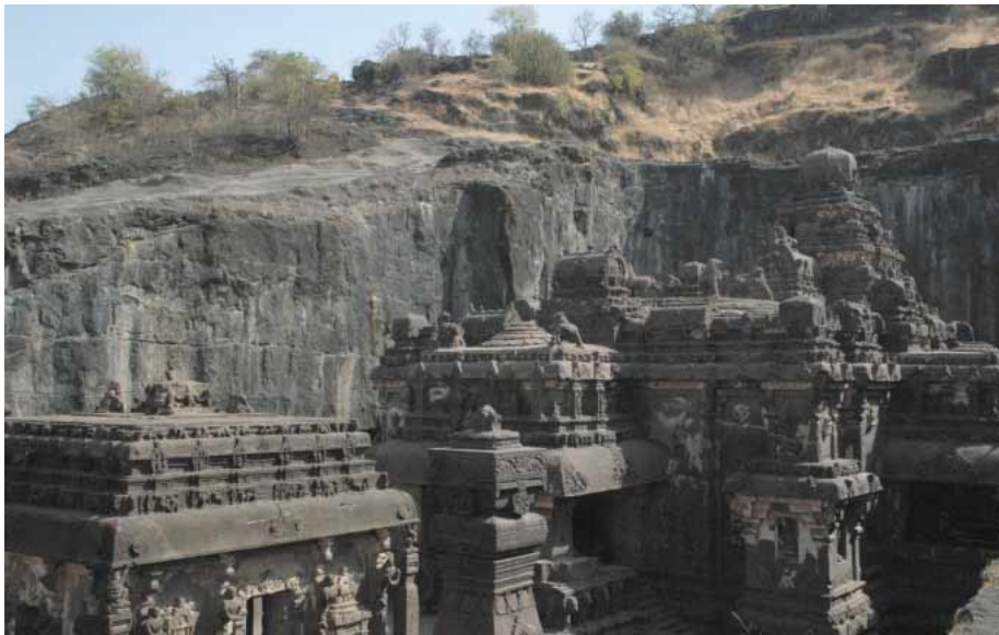
インドマハラシュトラ州エローラ洞窟石窟寺院郡 (世界遺産)

インド人が太古より崇めるカイルース山は、日本の古代人が敬愛した須弥山。インドの古代人はその神殿を222年掛けて紀元10世紀に造営。インド鉄道は今年創業155年を迎え、人々のライフラインとして益々延伸・発展している。