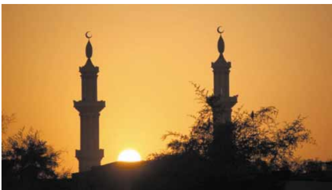
テク・ビジからの帰路、夕日がモスクの影に沈む 詳細は45ページ