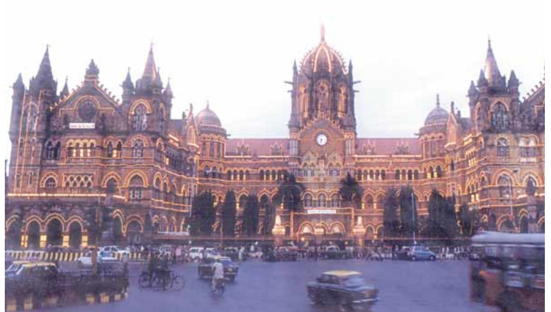
インド鉄道発祥の地ムンバイChhatrapati Shivaji Terminus