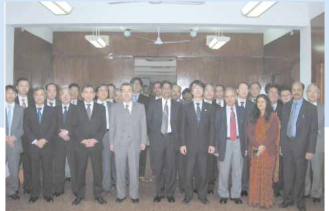
インド鉄道省にて・会議参加者 詳細は99ページ