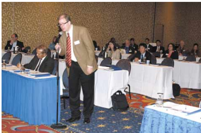
アナハイムにおける質問者 詳細は100ページ

1月30日にアメリカ合衆国アナハイム、2月1日にサンフランシスコにおいて高速鉄道セミナーを開催した。