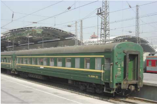
北京 - ピョンヤン間の国際列車に使用されている硬臥車YW18 詳細は26ページ

今回は、今や稀少車となった観のある電源車についてそのプロフィールを紹介してみたい。