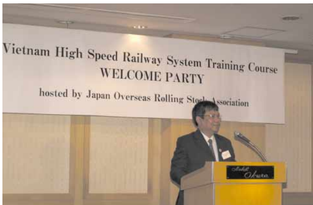
ベトナム国鉄副総裁挨拶 詳細は98ページ

ベトナム南北高速鉄道計画を推進する活動の一環として民間を代表し、歓迎会を開催した。