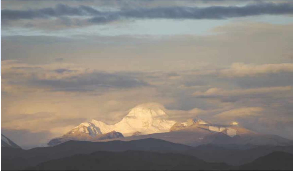
チベット・聖峰カイルース山 (標高6656M)