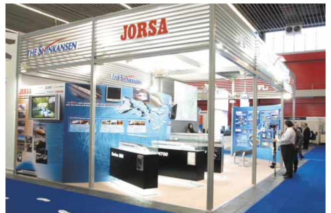
日本コーナー 詳細は101ページ

世界高速鉄道会議および展示会が3月17日から19日の3日間、オランダ・アムステルダムで開催された。