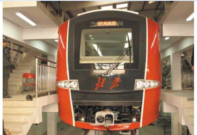
北京空港線 詳細は53ページ