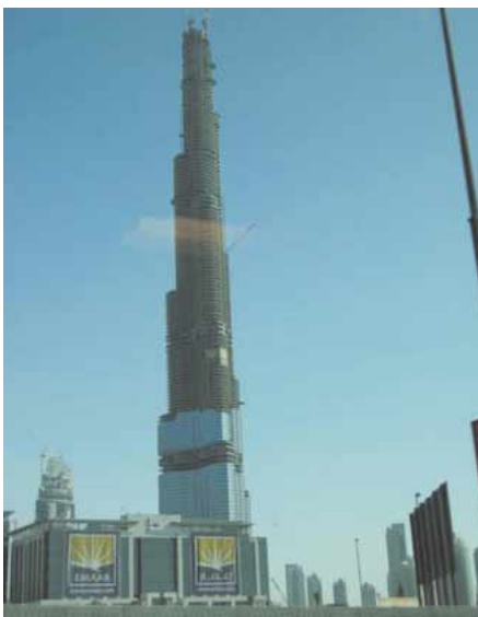
高層ビル「バージュ・ドバイ」。 世界一の高さを目指す。 詳細は45ページ

何事も「世界一」を目指しているドバイ・・・ この地で今展開されている中東情勢についてお伝えする。